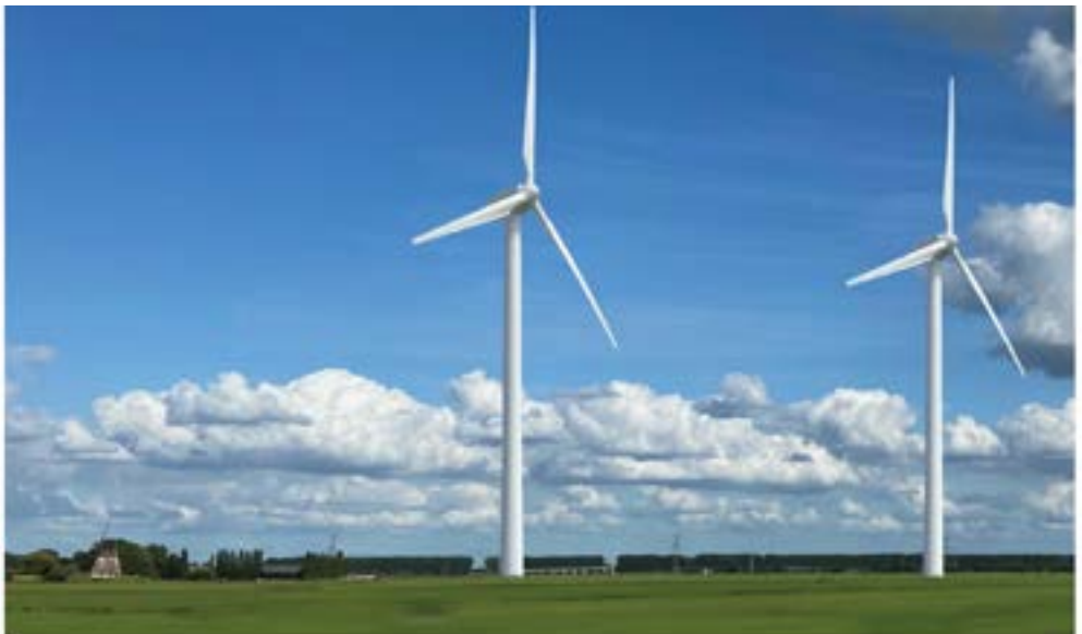
impressie van de nu bekende plannen, geconstrueerd met een schaalmodel