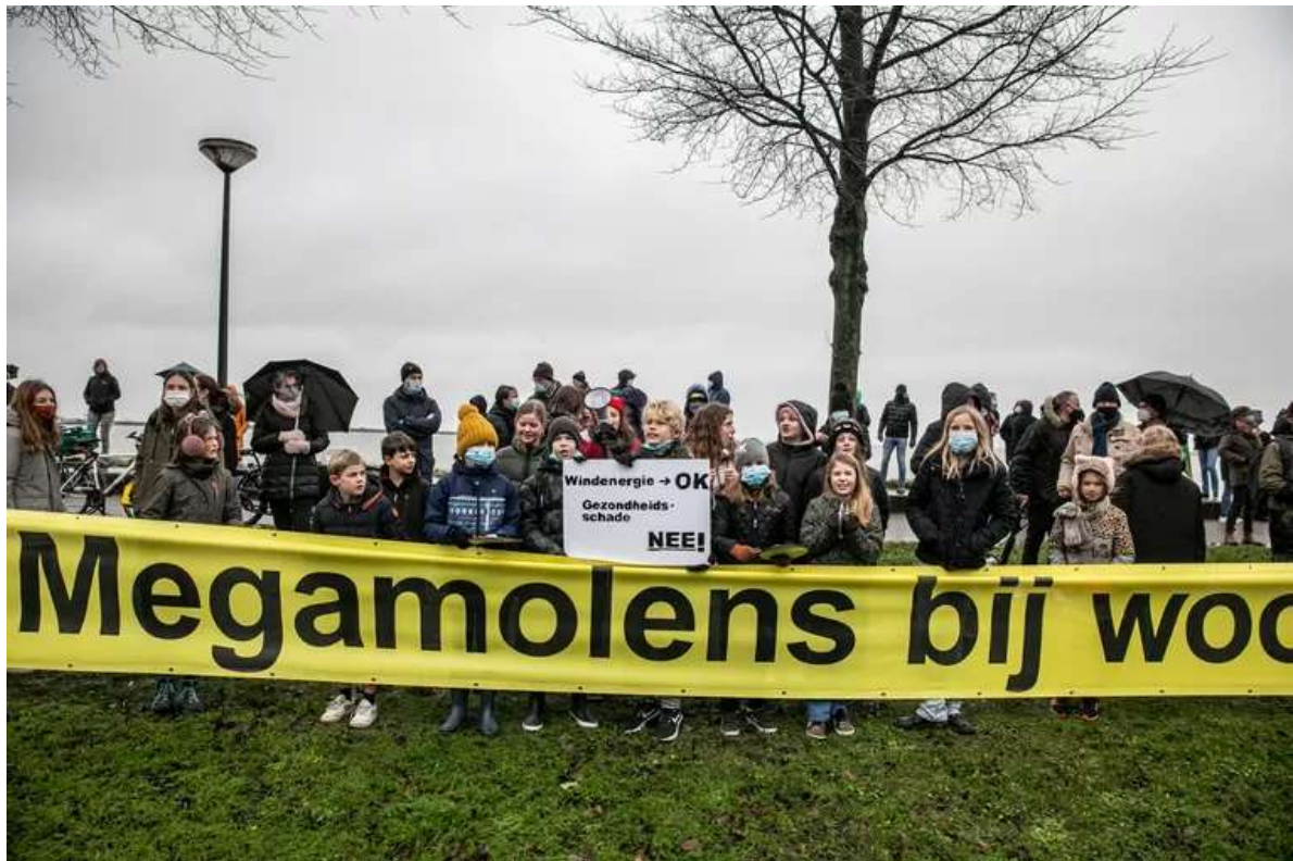
Protest tegen de komst van windmolens bij IJburg.