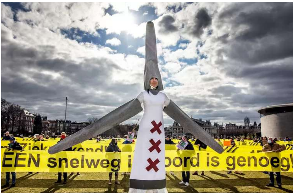
Een eerder protest van Windalarm op het Museumplein.

In totaal hadden zeventig insprekers zich opgegeven om bij de gemeenteraad hun beklag te doen. Hun actiegroep Windalarm wil dat