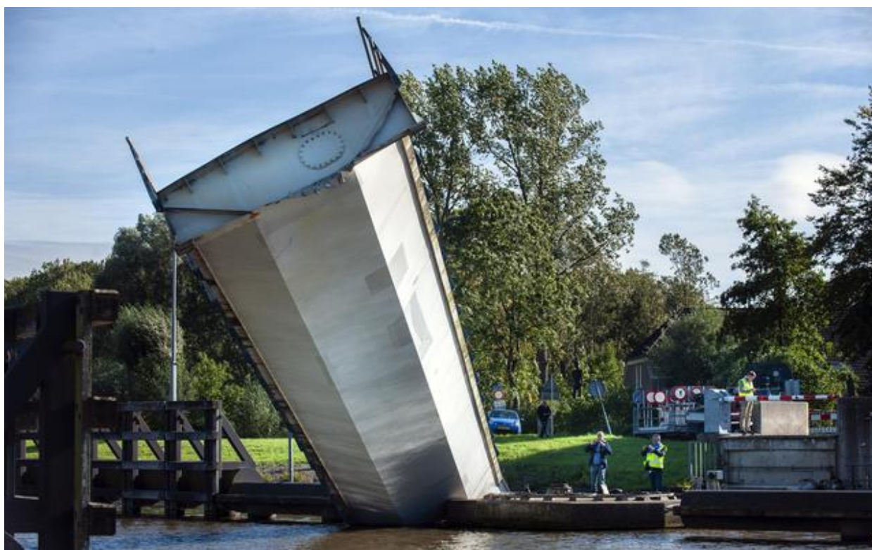
De Paddepoelsterbrug na de aanvaring in 2018. Rijkswaterstaat liet de restanten meteen opruimen en onderzocht niet of de brug, in afwachting van een nieuwe, kon worden hersteld.

Een adviesbureau raamt de kosten nu op 15,7 miljoen euro. Dat betekent dat het bijna vijf jaar na de aanvaring, op 26 september 2018, nog steeds niet zeker is dat er een nieuwe brug over het Van Starckenborghkanaal komt. Al gaat Groningen daar nog wel vanuit: in 2027.